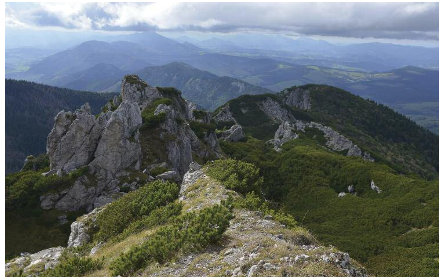
Radové skály – chodník ze Sivého vrchu