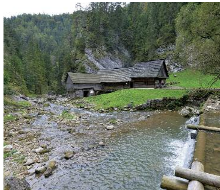
Vodní mlýn v zapadlé soutěsce Kvačianské doliny

Sobota 22. září 2018 až sobota 29. září 2018 Spolková výprava na slovenskou Oravu, Liptov, Roháče, i do polského Krakova a solných dolů ve Wieliczce je bo- hatě zdokumentována na jjhs.rajce.idnes.cz .