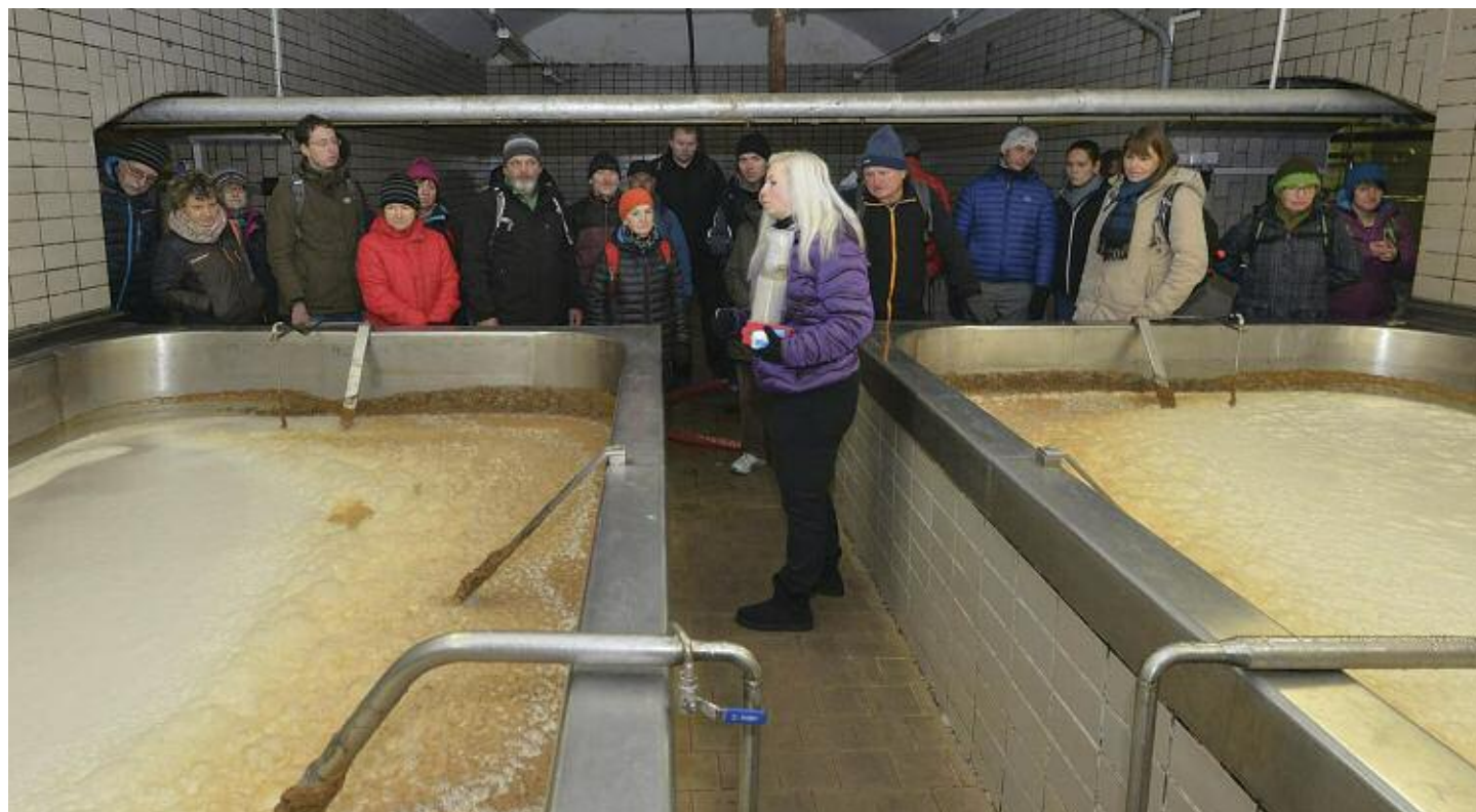
Toto je v pořádku – zde zraje klášterské pivo (z exkurze do pivovaru)

Facebook: www.facebook.com/horskyspolek.cz