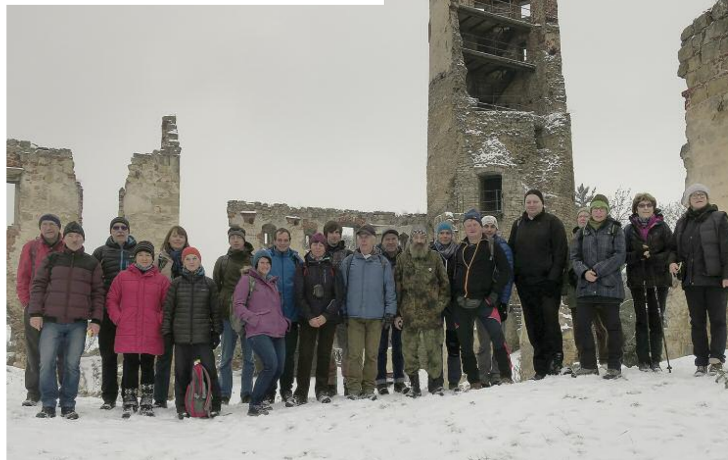
Naše výprava do Klášterského pivovaru kráčela z Bakova nad Jizerou pestrou krajinou po Zlaté stezce Českého ráje, ze které jsme si „odskočili“ na zimní prohlídku zříceniny hradu Zvířetice