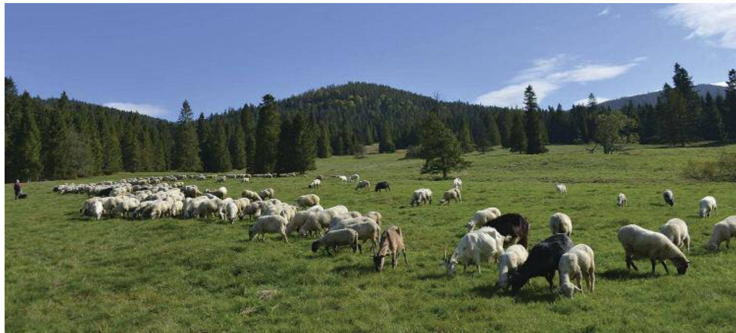
Kolorit oravských planin