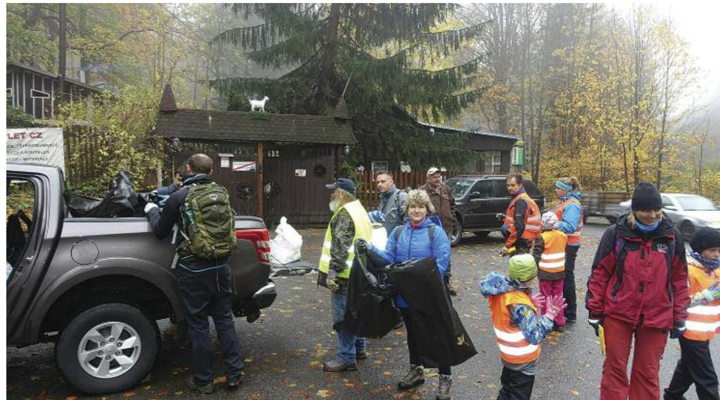
Výchozí a konečné místo na parkovišti U Kozy v Oldřichovském sedle. Jak už to bývá, po řádném úklidu následovala pořádná bašta.