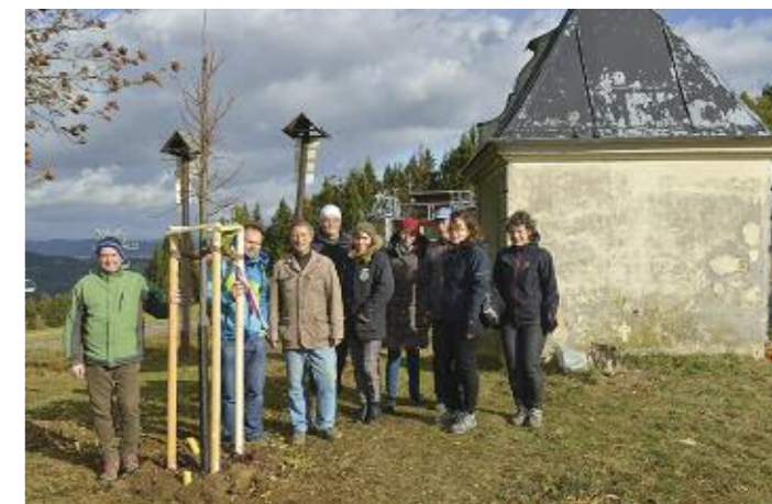
Lípa republiky na Javorníku