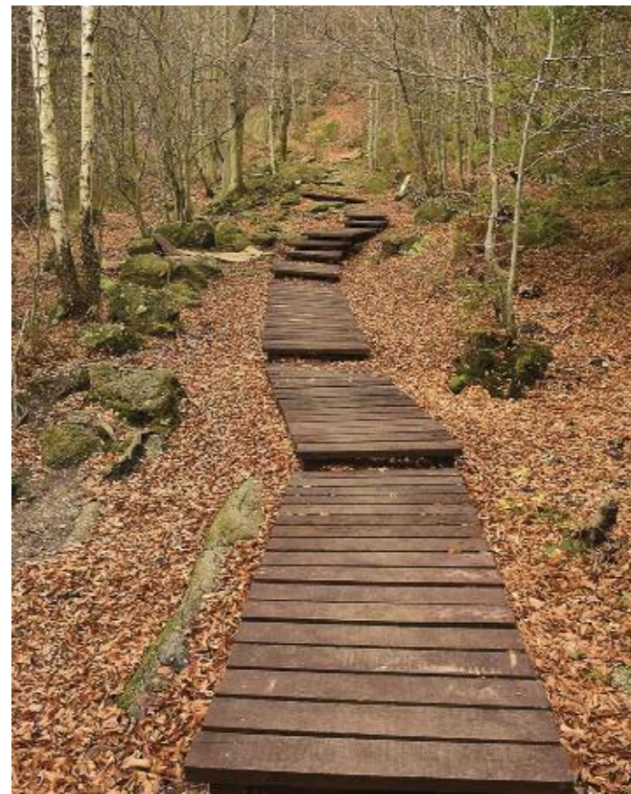
Chodník z natíraných dubových fošen

Hlavním cílem projektu je tedy usměrňovat pohyb návštěvníků v rezervaci a omezit a předcházet vodní erozi. Turisté budou automaticky volit nejpohodlnější upravenou část stezky a přestanou využívat alternativní