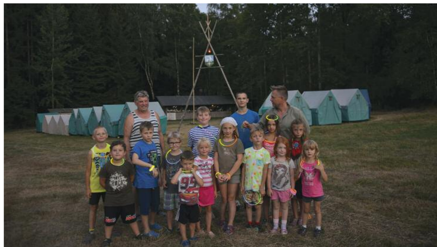
Střípky z letního tábora