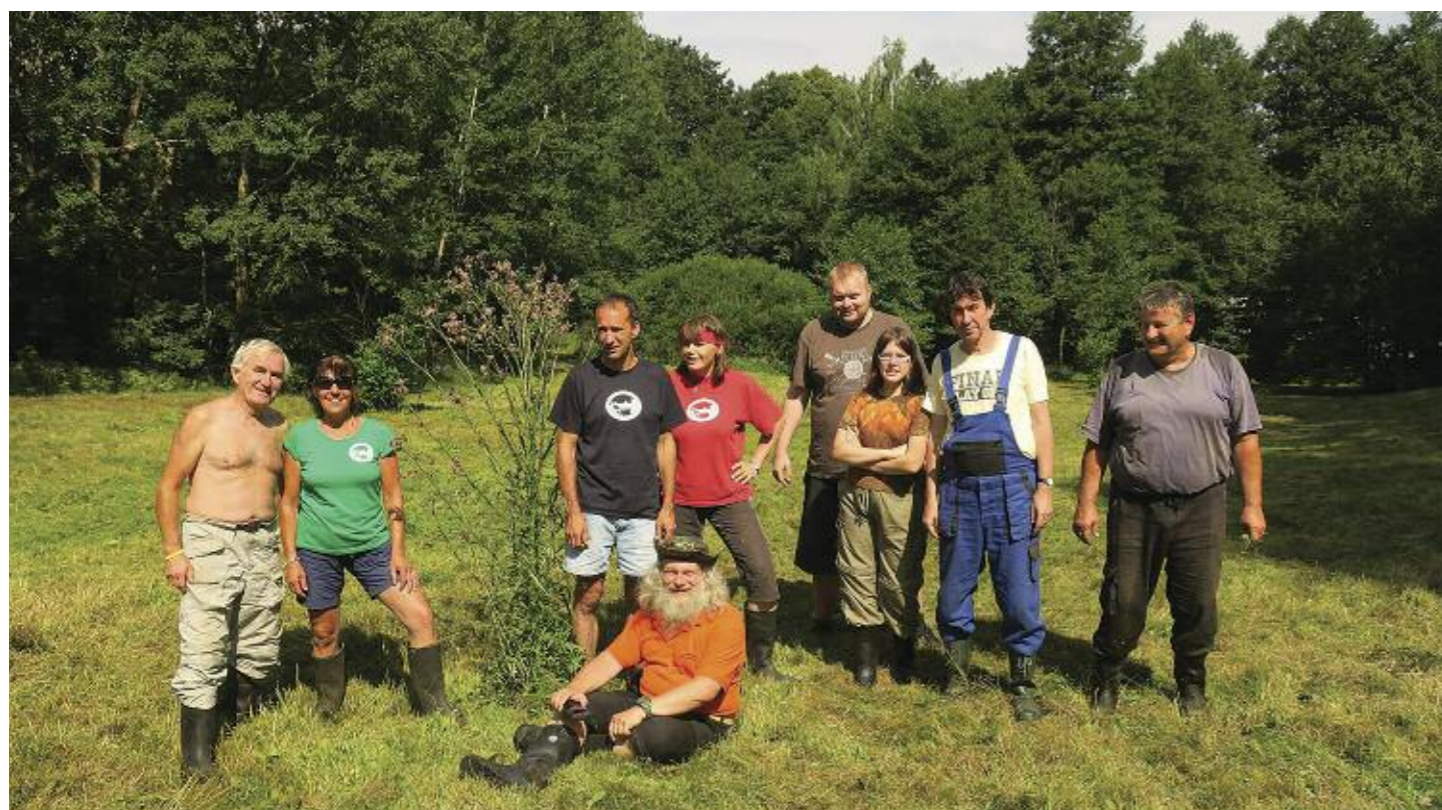
Sekáči v Bílém Potoce