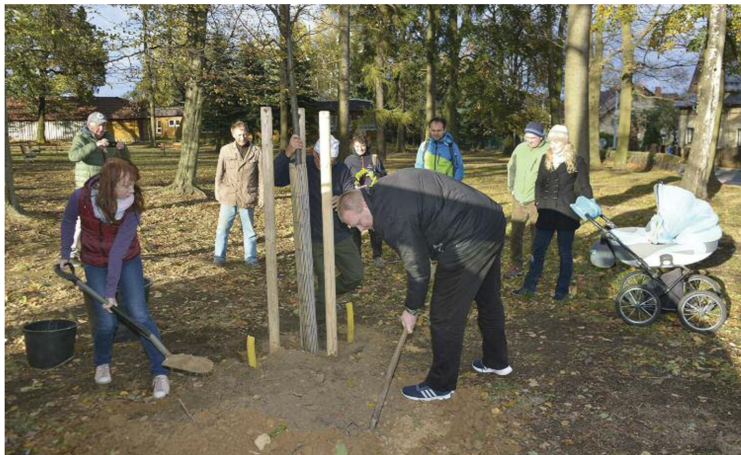
Zasazení lípy republiky v Hanychově