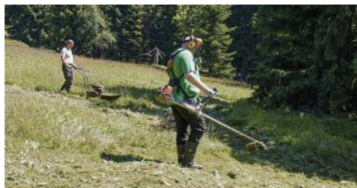
Znovu na Jizerce