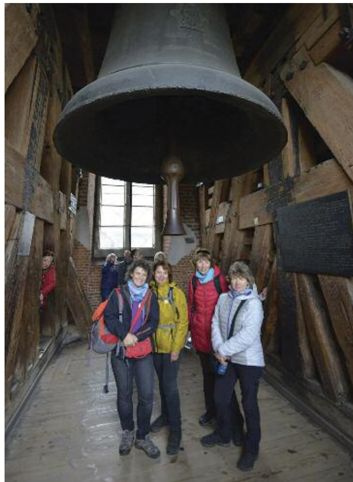
Zvon Zygmunď ve zvonici královského hradu v polském Krakově. Solné doly ve Wieliczce