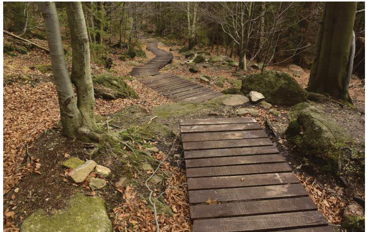
Chodník překrývá podmáčený a bahnitý terén

Projekt je financován z Operačního programu životní prostředí , na vlastní spoluúčast spolku přispěly Nadace Ivana Dejerala pro ochranu přírody a Liberecký kraj. P. Schneider, M. Vinař