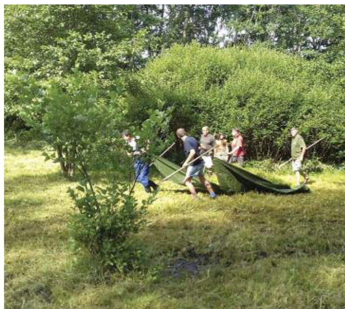
Zamokřená louka v Bílém Potoce