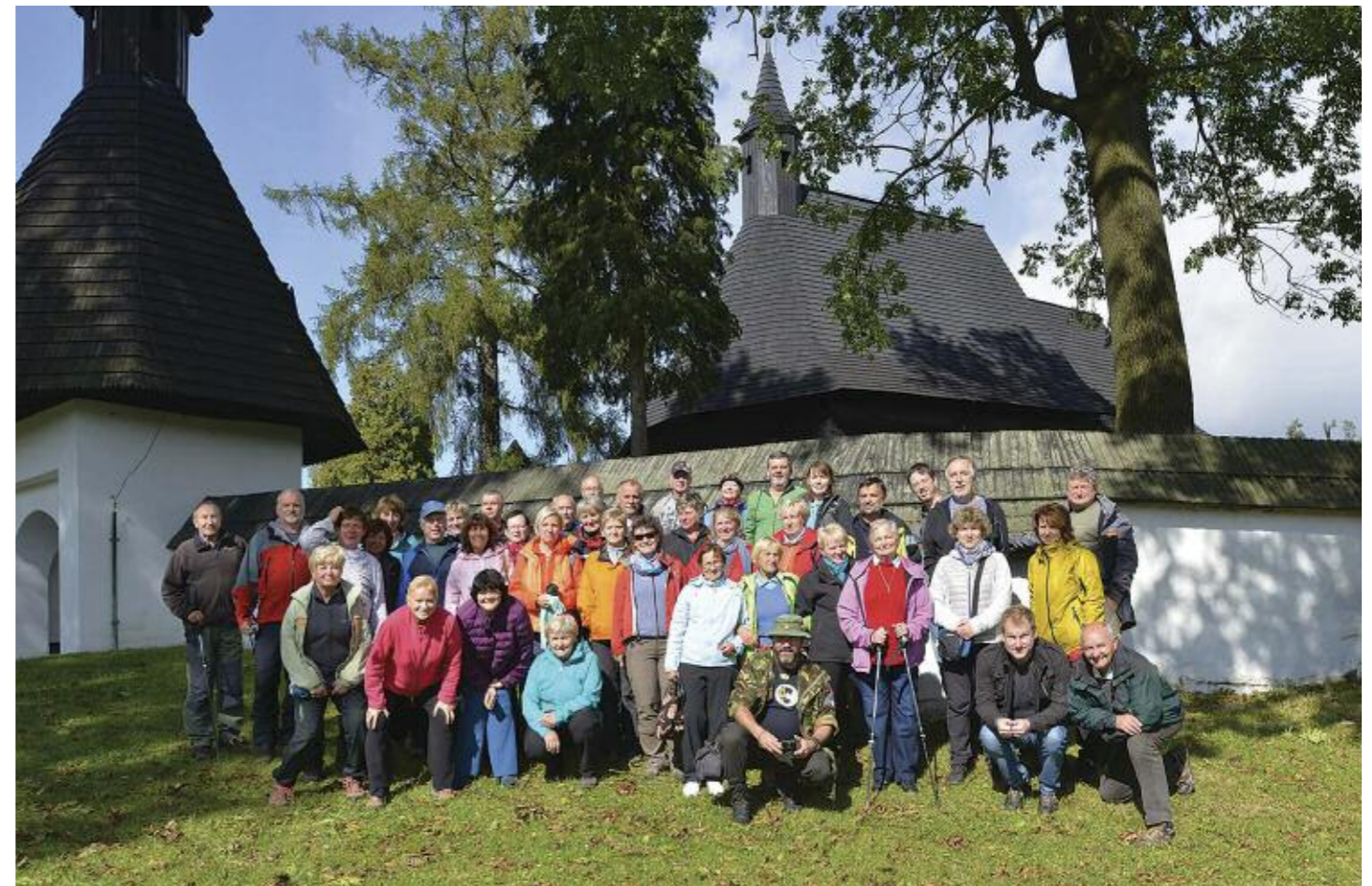
U dřevěného kostelíka v Tvrdošíně – památka UNESCO