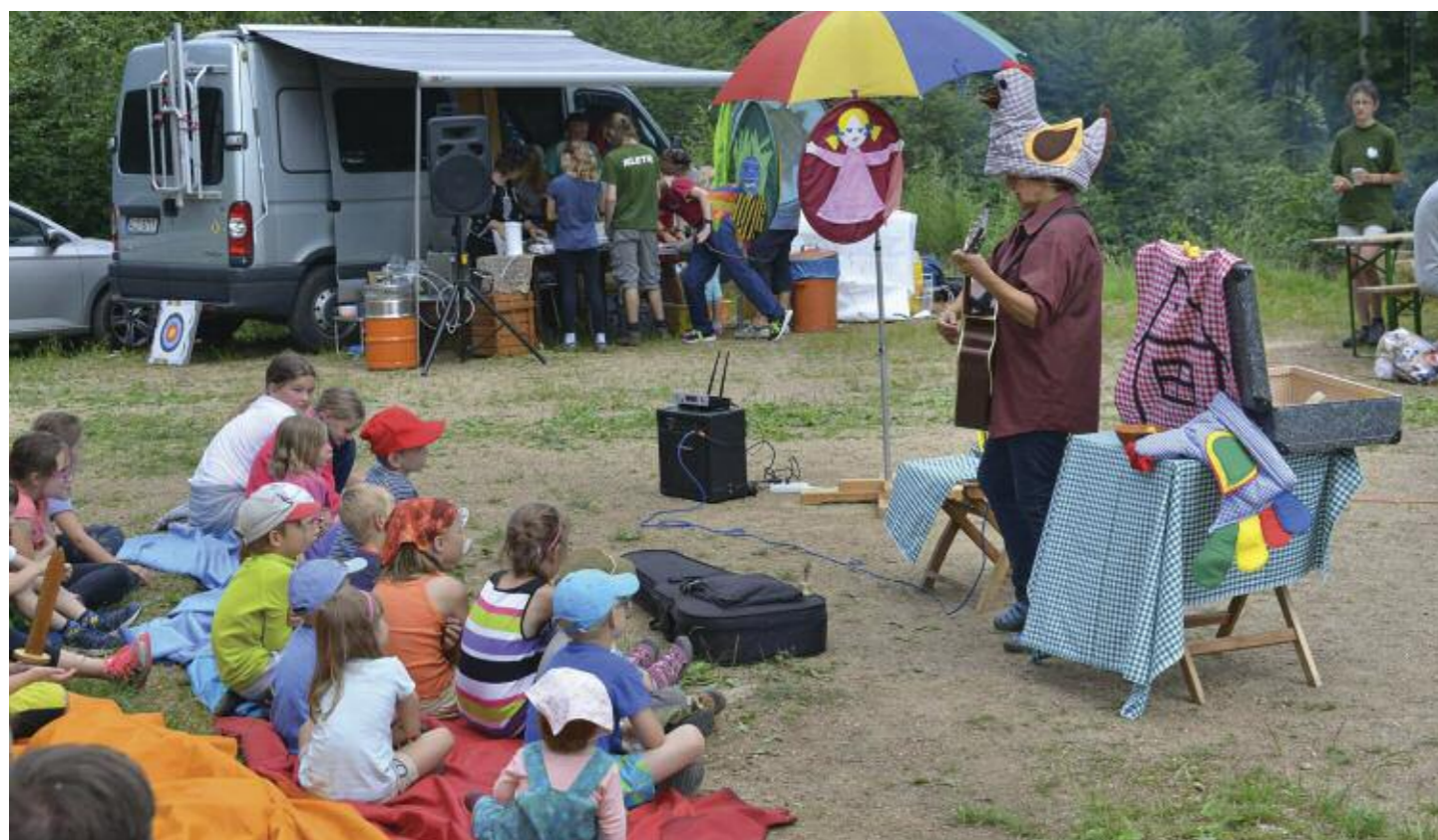
Tradiční slavnosti v lesním divadle pod skalní vyhlídkou na Martinské stěně