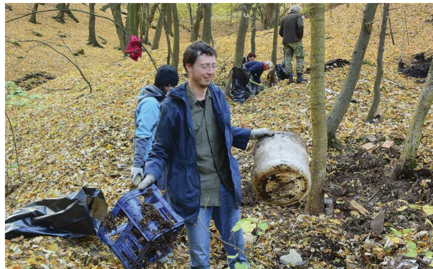
V Ruprechticích jsme odpadky posbíranými v lesíku naplnili velký kontejner