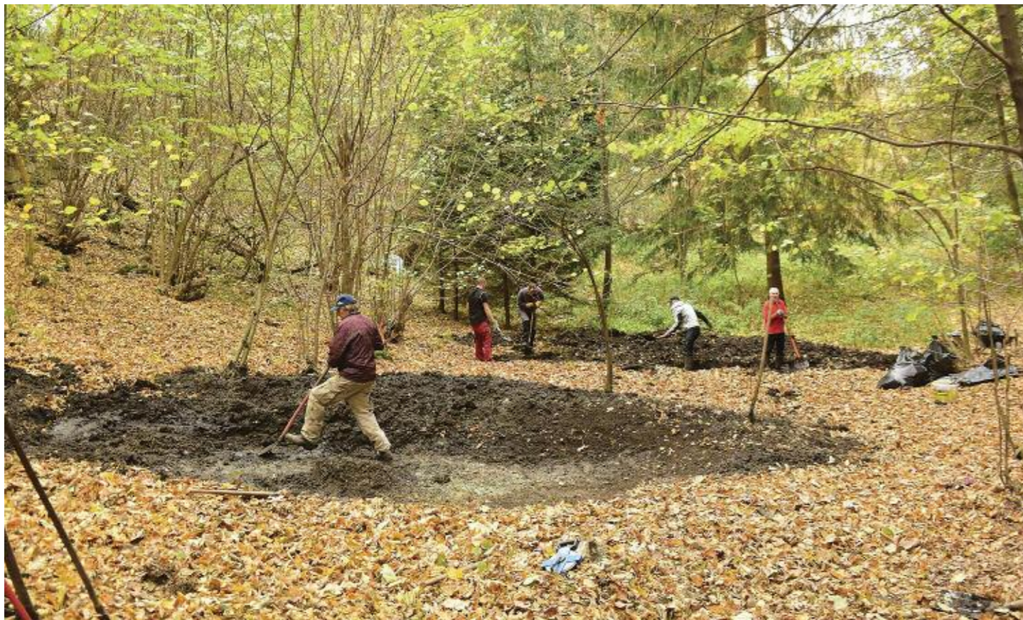
Současné s úklidem lokality byly hloubeny tůně pro obojživelníky

vyhloubené pod úroveň terénu. Tůně se ihned začaly plnit podzemní i povrchovou vodou z dešťových srážek a přirozeného povrchového odtoku z okolního terénu. Lze tak předpokládat, že ve vlhčím období budou tůně naplněny vodou až po úroveň terénu a vytvoří tak ideální biotop pro rozmnožování obojživelníků a dalších vodních a na vodu vázaných živočichů.