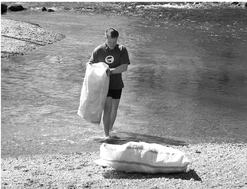
Shromažďování pytlů s odpady