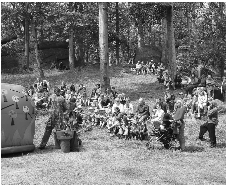
Slavnosti slunovratu na Martinské stěně 23. června 2007