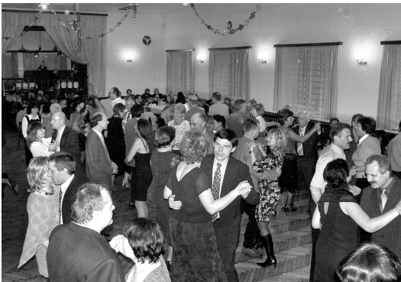
Spolkový ples v sále restaurace U Košků 16. února 2007