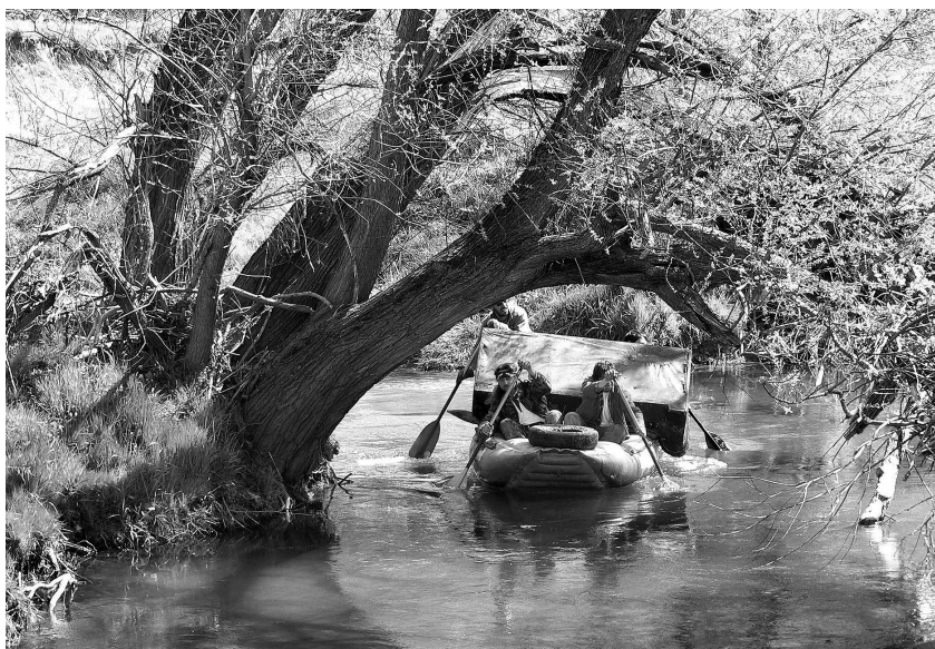
Mimořádný nález - zánovní kožený otoman

v láhvi, sifon od umyvadla, kanystry od oleje, hračky apod. To, že se v meandrech ukládají věci již hodně dlouho, dokazuje například nález zrezivělé německé vojenské přilby z druhé světové války. Mezi pneumatikami byla zase objevena pneumatika značky Baťa ze třicátých let minulého století. Pytle na odpady zdarma poskytla obec Černousy a odvoz odpadu zajistila obec Višňová. Akce byla finančně podpořena Krajským úřadem Libereckého kraje, společností Termizo, a. s. a městy Frýdlant v Čechách a Raspenava.