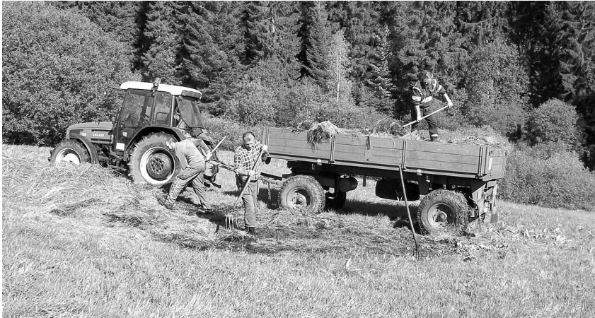
Odvoz pokosené trávy z Přírodní památky Tichá říčka u Hrabětic