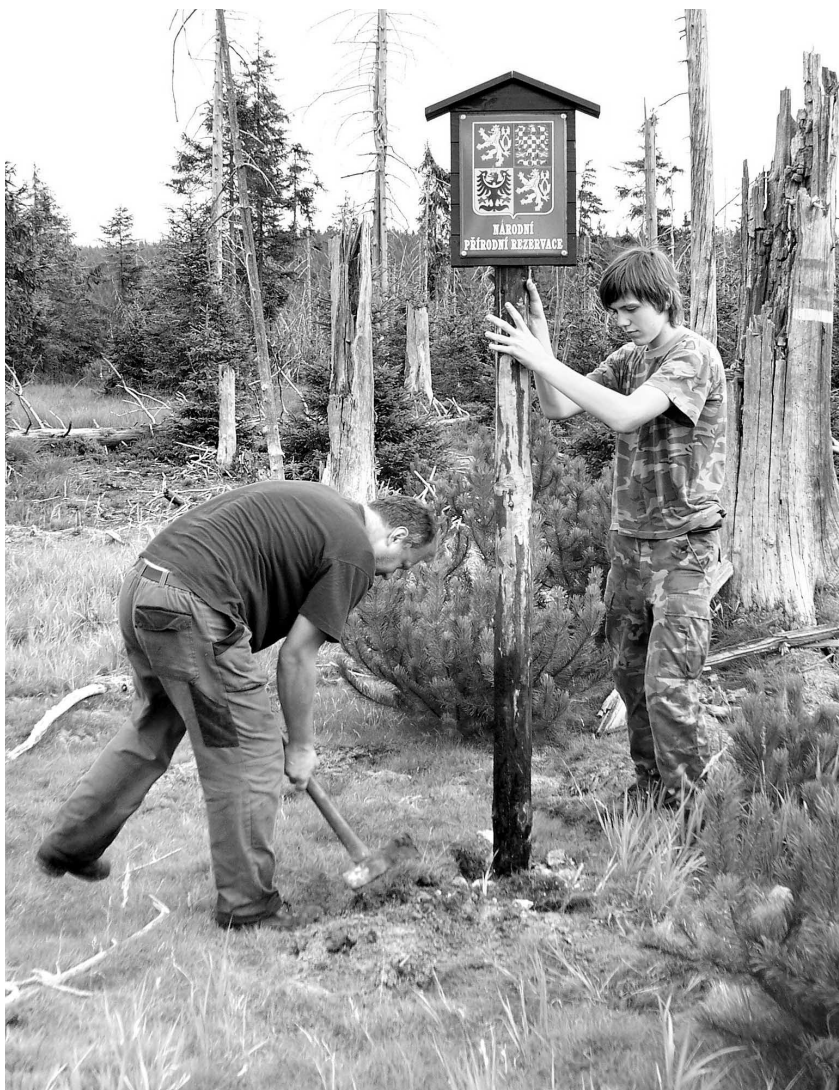
Obnova hraničních tabulí Národní přírodní rezervace Rašeliníště Jizery

v regionu z pohledu historického, kulturního nebo přírodovědného. Organizujeme výlety a vlastivědné exkurze, seznamujeme se s méně známými a navštěvovanými místy s cílem vytvářet a pěstovat vztah k historii i současnosti regionu, jeho kulturním tradicím a hodnotám. Současně provádíme rekonstrukce a údržbu vyhlídkových míst v Jizerských horách a okolí. Organizujeme nebo spolupracujeme při různých akcích pro veřejnost, spojených se sportovně-turistickými výkony i kulturními pořady v přírodě, např. Soutěž Stovkařů, slavnosti na Ještědu, Slavnosti slunovratu aj.