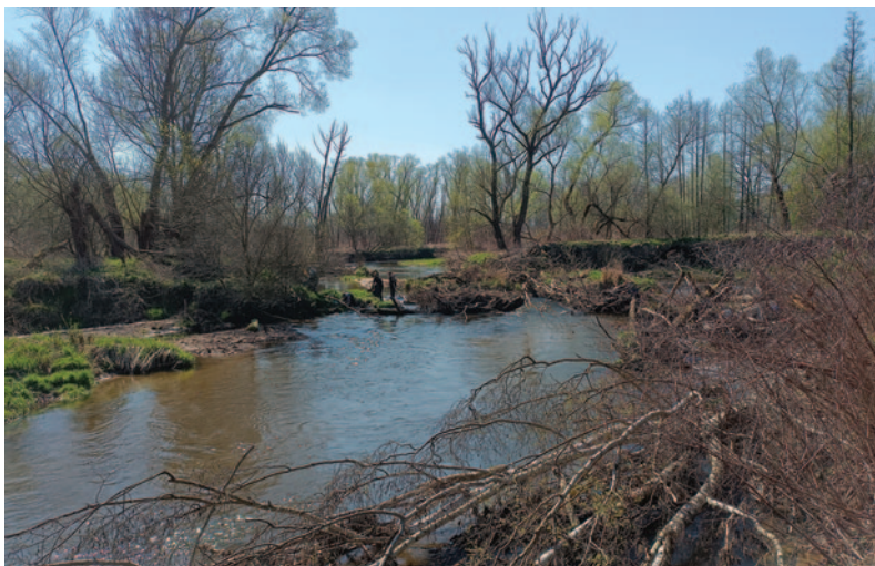
Úklid meandrů Smědé Foto Pavel Schneider, Michal Vinař (dole)