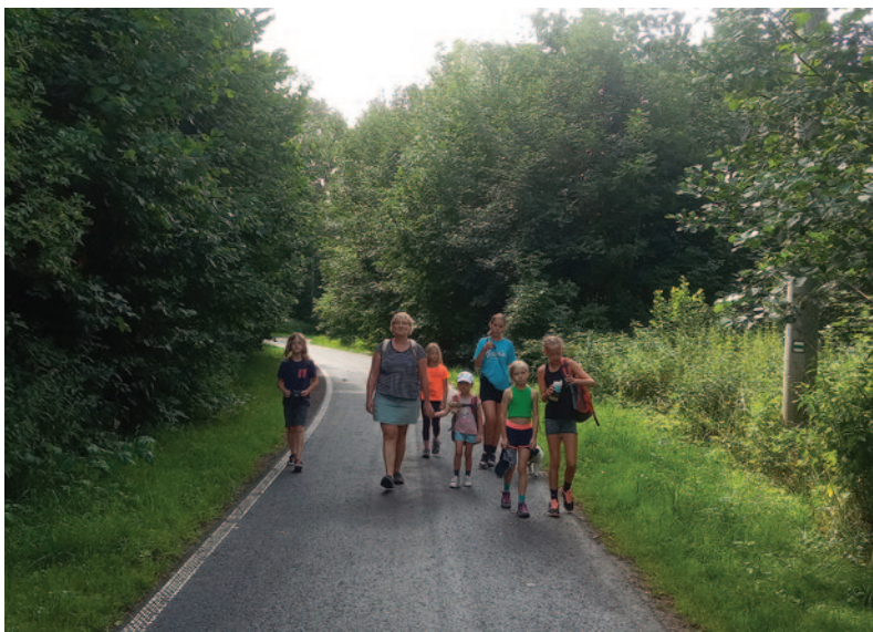
Vyrážíme na výlet - letní tábor Lobendava