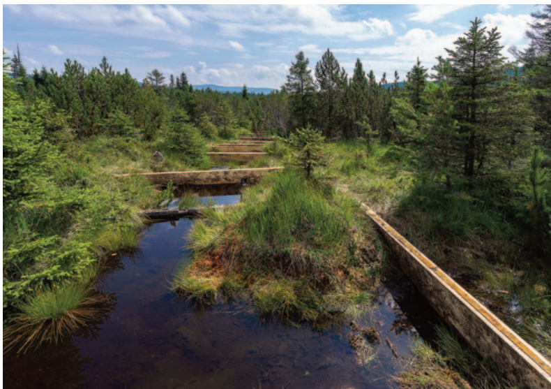
Přehrádky v ochranném pásmu NPR Rašeliniště Jízery