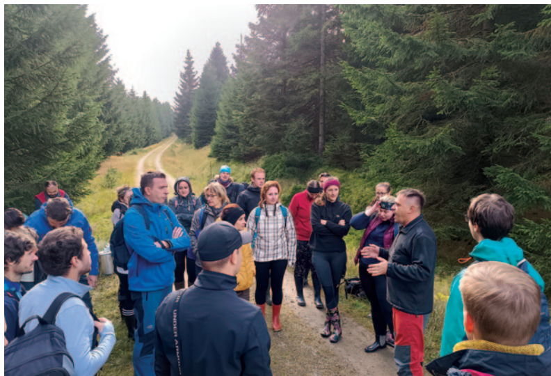
Zapojení zaměstnanců společnosti Knorr-Bremse do prací pro ochranu přírody. Porada před zahájením akce a udělení důležitých pokynů pro práci.