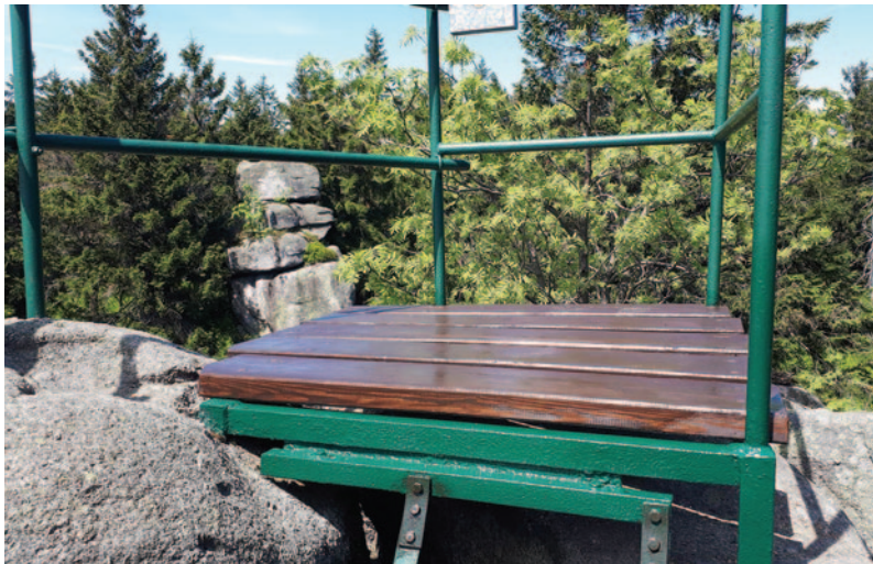
Oprava vyhlídky Sněžné věžičky