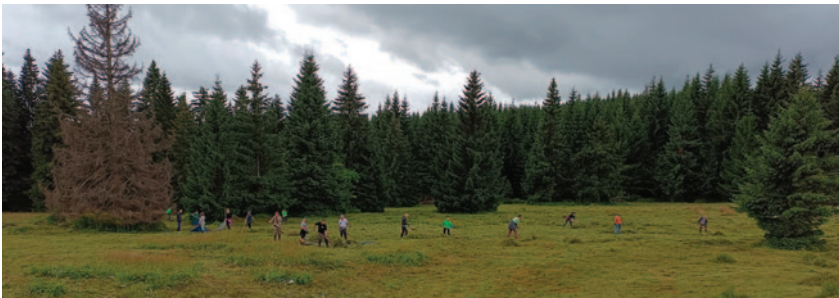
Sekání a shrabování trávy na Jizerce