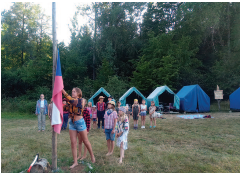
Letní tábor pro děti s rodiči a prarodiči v Lobendavě