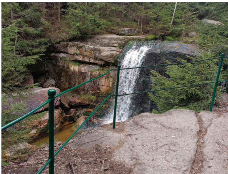
Oprava vyhlídky u vodopádu Jedlové