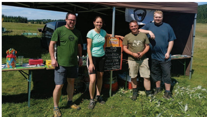
Sympatická obsluha spolkového stánku zajišťovala občerstvení na akci Den a noc na Jizerce