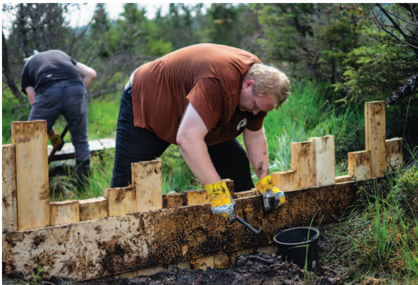
Výstavba přehrádek v ochranném pásmu NPR Rašeliniště Jizery

Zejména v praktických opatřeních pro ochranu přírody rozšířil JJHS svoji působnost na téměř celé území Libereckého kraje. Svoji činnost zaměřujeme především na práci v terénu, na péči o chráněná území v Jizerských horách, na Ještědském hřbetu, v Českém ráji, Lužických horách, na Frýdlantsku i Českolipsku. Vyznačujeme hranice rezervací, kosíme horské louky se vzácnými druhy rostlin, likvidujeme nepůvodní invazní rostliny, vytváříme nové biotopy pro vodní a mokřadní faunu i flóru, budujeme a udržujeme zařízení k usměrnění pohybu návštěvníků, stavíme oplocenky k ochraně lesních porostů apod. V posledních letech se podílíme na revitalizaci vybraných rašelinišť v Jizerských horách hrazením odvodňovacích příkopů, které zde byly v minulosti vytvořeny.