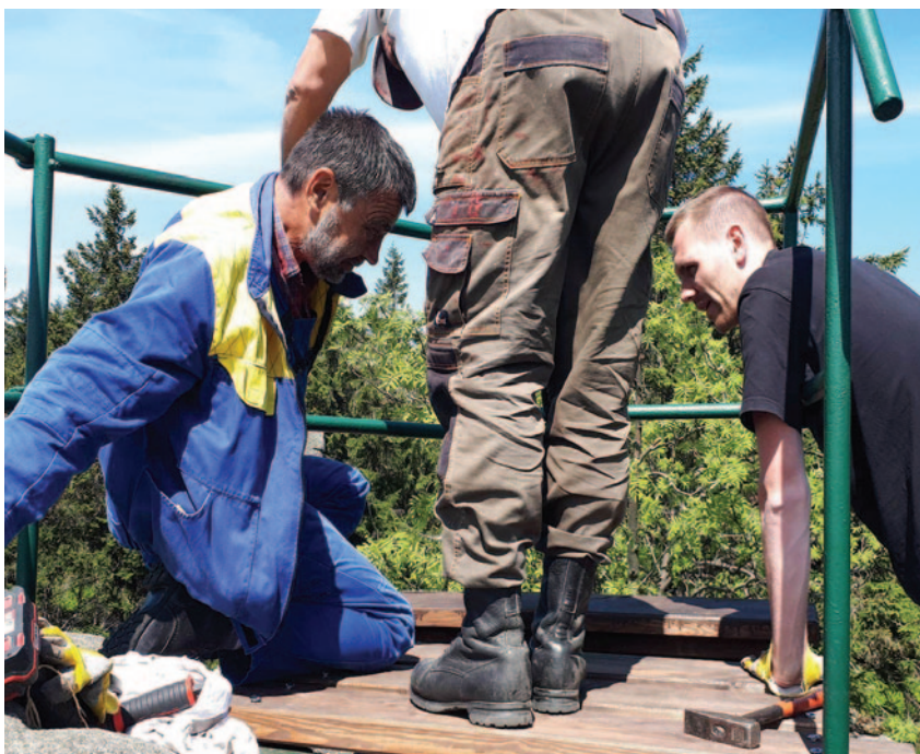
Oprava vyhlídky na Sněžných věžičkách