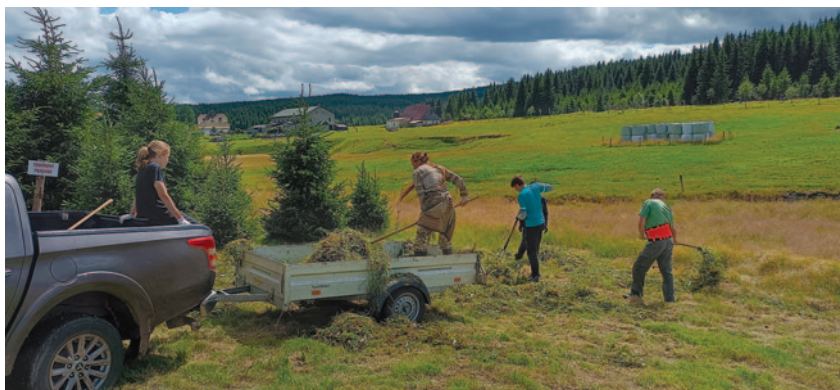
Shrabování posekané trávy na Jizerce

Pozemkový spolek pro přírodu a památky severovýchodních Čech, původně nazvaný Severák, byl založen v roce 2000 jako součást Jizersko-ještědského horského spolku. V červnu 2001 získal do pronájmu první pozemek na Václavíkově Studánce, která již v portfoliu Severáku není, a v dubnu 2002 byl akreditován ÚVR ČSOP a zařadil se tak mezi registrované pozemkové spolky v ČR. Hlavním posláním pozemkového spolku JJHS je přímá ochrana vybraných lokalit s významnou přírodní či kulturně-historickou hodnotou. Tato ochrana je prováděna nejprve nabytím vlastnických nebo jiných věcných práv ke zvoleným nemovitostem (dlouhodobý pronájem) a následnou odpovídající péčí o ně. Severák má aktuálně na starosti tři lokality, tj. pozemek v Kořenově, komplex mokřadů a vlhkých luk v Bílém Potoce a cennou louku zvanou Pralouka v osadě Jizerka.