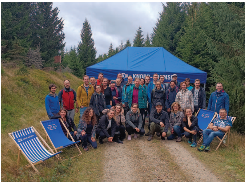
Účastníci, kteří pomohli s obnovou rašeliniště v ochranném pásmu NPR Rašeliniště Jizery