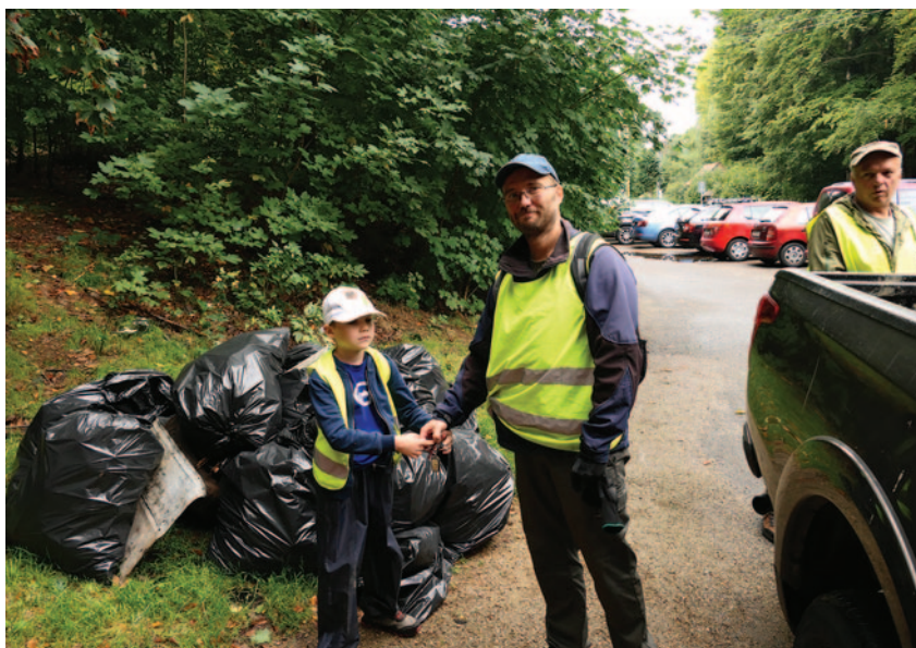
Úklid odpadků kolem silnice Oldřichov v Hájích-Raspenava