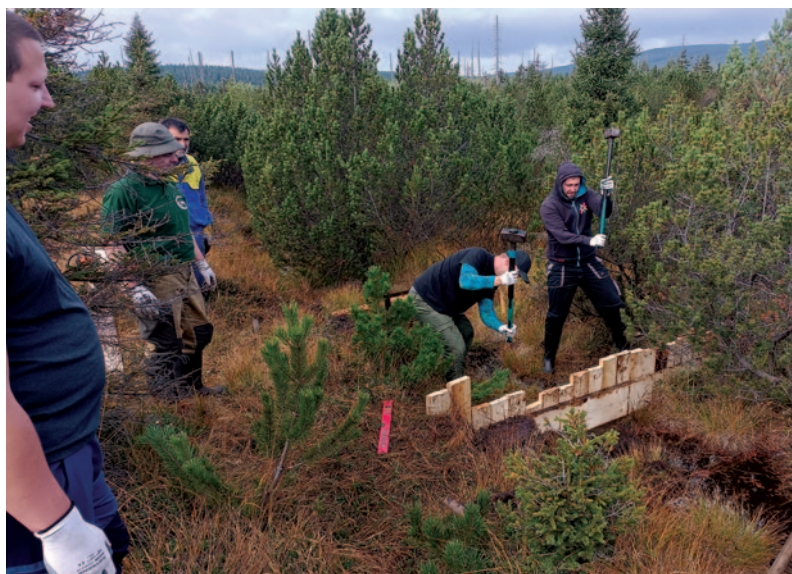
Silní jedinci se při práci chopili i těžších nástrojů