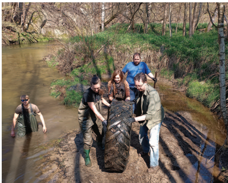
Úklid odpadků v PR Meandry Smědé