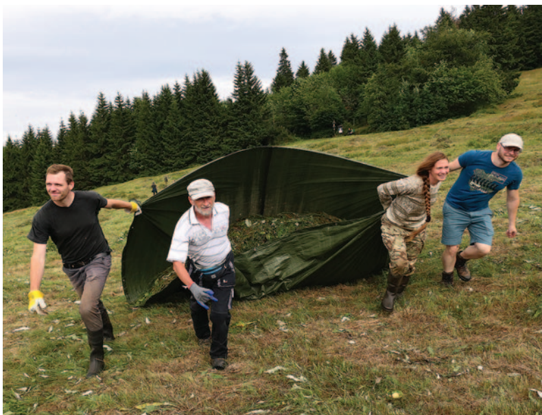
Shrabování a úklid posekané trávy z Upolínové louky na Jizerce