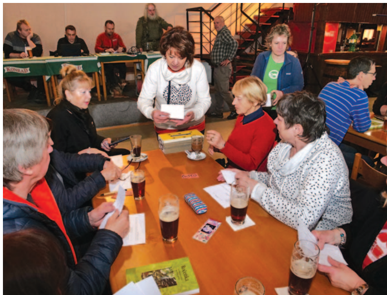
Výroční členská schůze ve Vratislavicích nad Nisou - volby