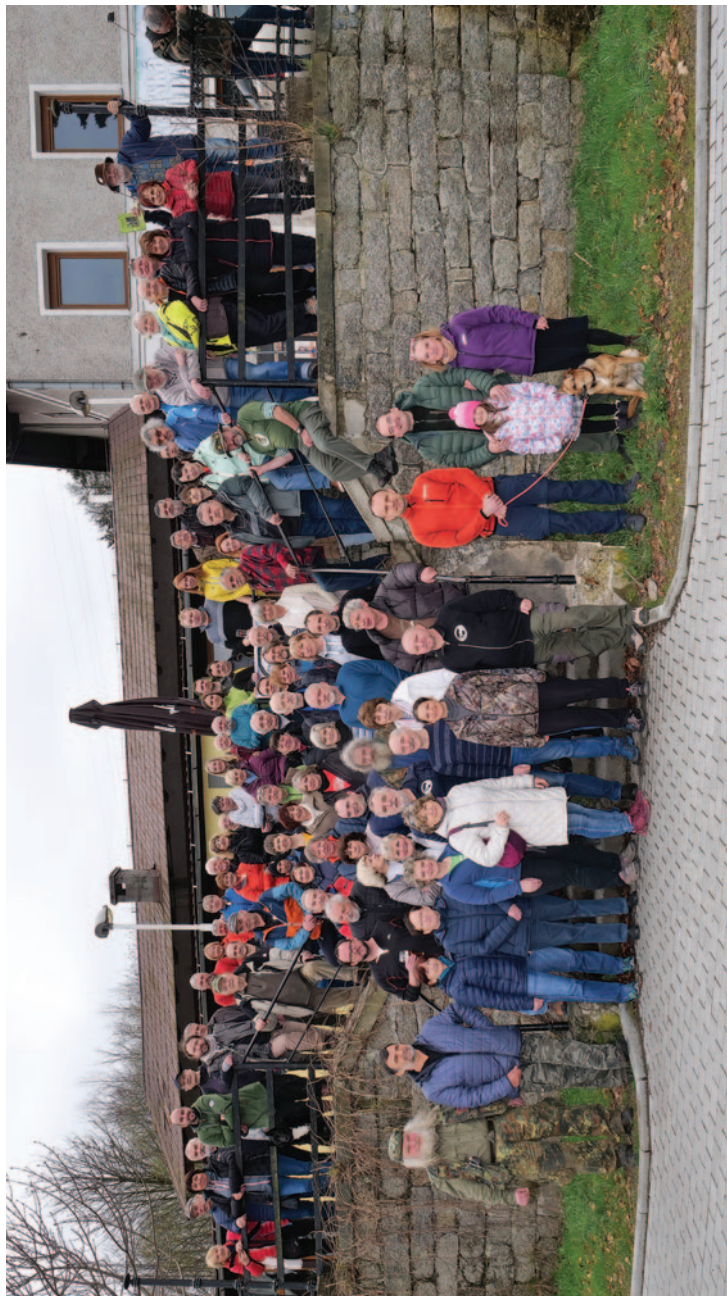
Společné foto z výroční členské schůze před restaurací vratislavického pivovaru 9. dubna 2023