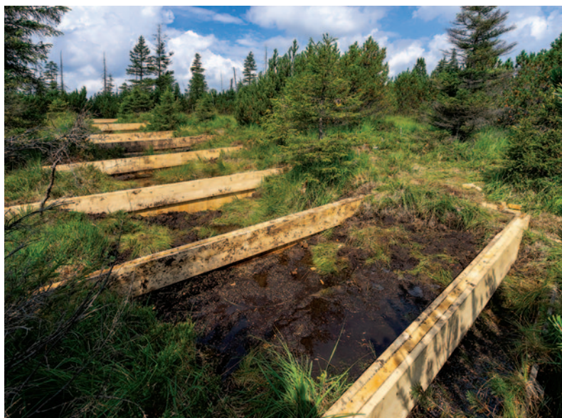
Výstavba přehrádek v ochranném pásmu NPR Rašeliniště Jizery