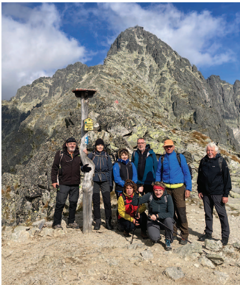
Vysoké Tatry - Velká Lomnická věža (2 214 m), v pozadí Lomnický štít

2. 12. 2023 - výlet do pivovaru JungBerg v Hořicích (viz samostatný článek).