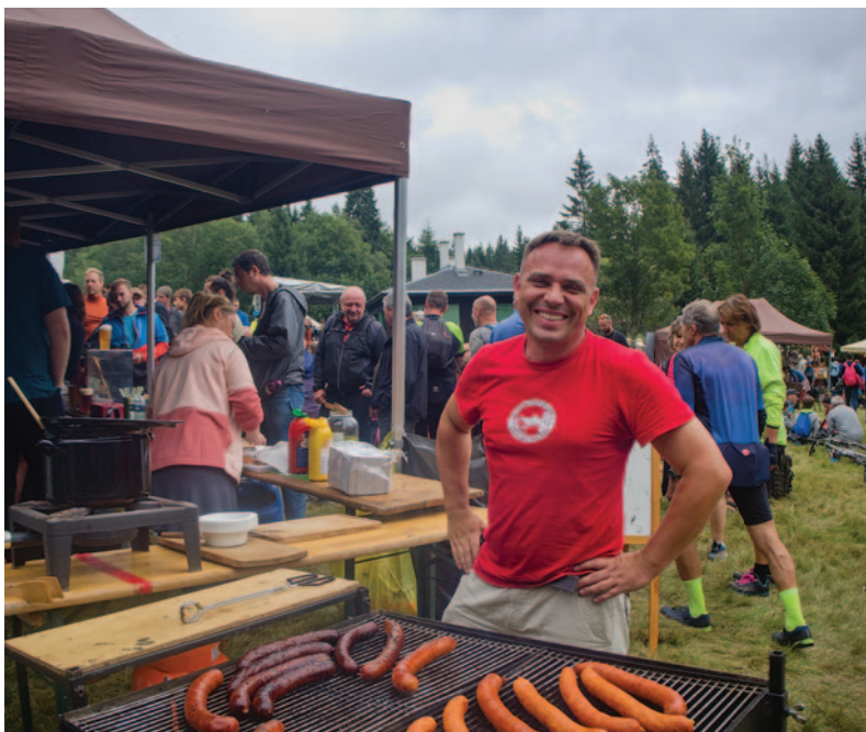
Sklářská slavnost v Kristiánově